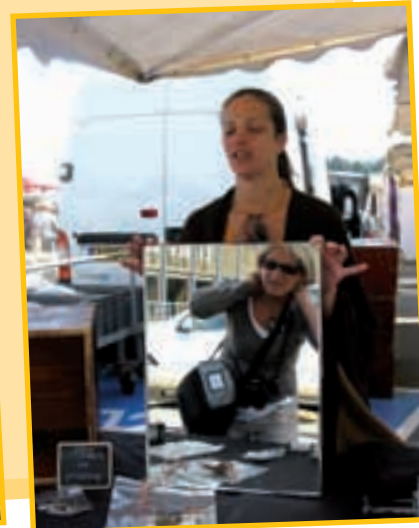
Dans le miroir