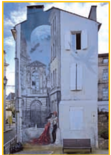
« Mémoires du XX e ciel », au square Saint-André.

**contrairement au repas de la cène, nous n'avons pas souvent été 13 à table mais 14, plusieurs invités se sont succédés tout au long du séjour. ▶