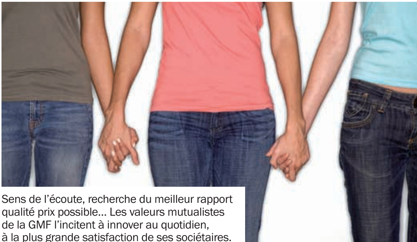
Serec Communication - Photo Getty Images

Sens de l'écoute, recherche du meilleur rapport qualité prix possible... Les valeurs mutualistes de la GMF l'incitent à innover au quotidien, à la plus grande satisfaction de ses sociétaires.