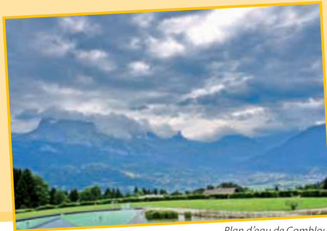
Plan d'eau de Combloux