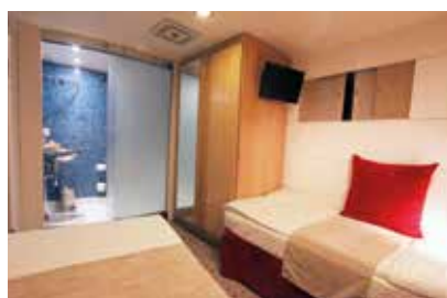
Cabine « A »