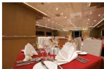
Restaurant, pont principal