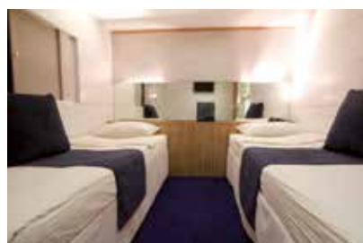
Cabine « P »